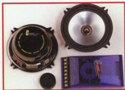
Ground Zero GZHC 130 2-Wege-Kompo

Technik: Euro-Chassis mit Aluminium-Membran und massivem Magnetschutz. Sehr wertig anmutendes, chrom-ähnliches Oberflächenfinish. 25-Millimeter-Kalotte mit metallbedampfter Folienmembran. Übersichtlich aufgebaute Frequenzweiche in peppig-blauem Plastikgehäuse. Klang: Im Hörcheck machte das Ground-Zero-Kompo jede Menge Spaß. Vor allem bei fetziger Musik legte es eine beachtliche Spielfreude an den Tag, und dies bei geringem Leistungsbedarf. Dass der sich Hochtöner einige störende Kieker nicht verkneifen konnte, ließ sich angesichts des recht angenehm klingenden Stimmbereichs leicht verschmerzen.